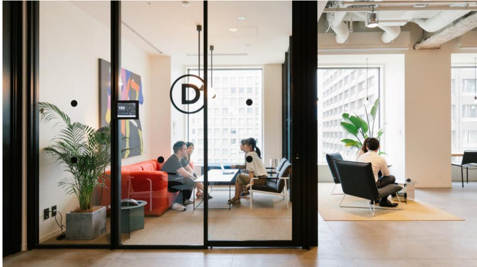
<WeWork 日比谷パークフロント 共有エリア>